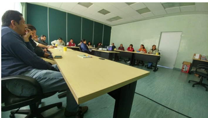
Curso de Seguridad, Bioseguridad y Biocustodia Aplicado a los Laboratorios de Control Analítico. Instalaciones: Comisión de Control Analítico y Ampliación de Cobertura (CCAYAC-COFEPRIS).