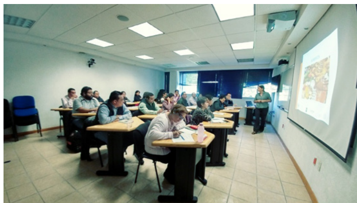
Curso de Tecnología de Alimentos. Instalaciones: Instituto de Química.

Los resultados del Contrato IQ-COFEPRIS son los siguientes: